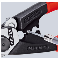
Nalisování koncové dutinky na tažné lano