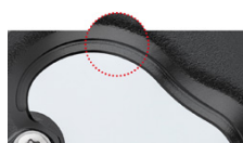
Přesně frézovaná a indukčně tvrzená hrana břitu