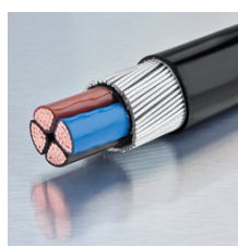
příklad kabelu armovaného ocelí