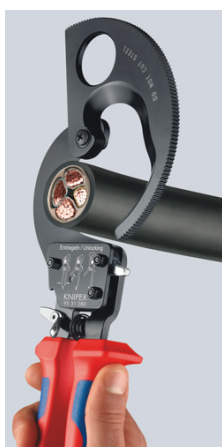
95 31 280: velká kapacita: max. Ø 52 mm / 380 mm 2