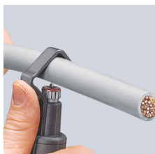
Nastavení nástroje pro obvodový řez