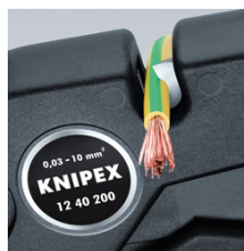
Štípačky na drát do 10 mm 2 vícežilový