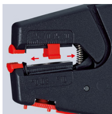
12 40 200: Nastavitelný délkový doraz