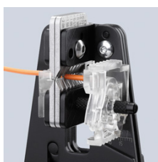
Čisté naříznutí izolace po celém obvodu