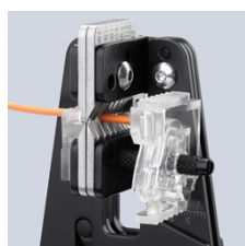
Čistě naříznutí izolace po celém obvodu