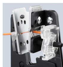
Tvarově se přizpůsobující odizolování díky precizním profilům nožů