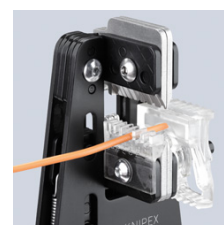
12 12 02 s vedením kabelu a délkovým dorazem